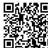
Submit Scoring Inquiry

NOTICE: When submitting a protest, request or report, the procedure (as set forth in the Racing Rules of Sailing and the Sailing Instructions) remains unchanged.