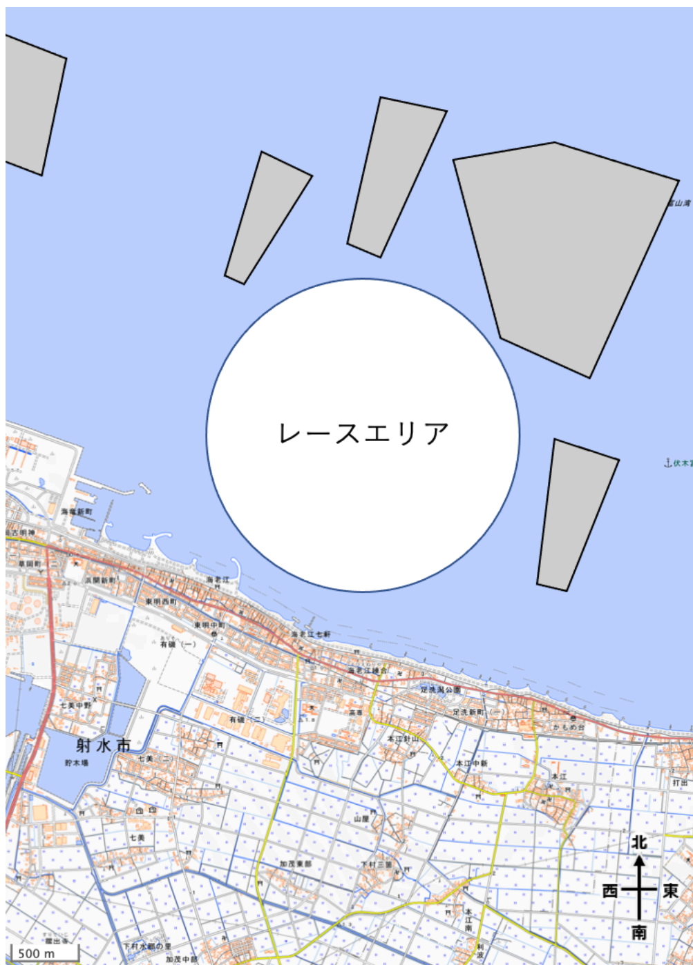
地理院地図を加工して作成